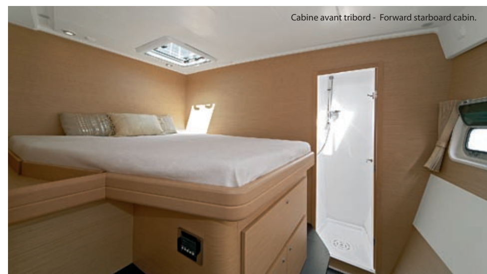
Cabine avant tribord - Forward starboard cabin.