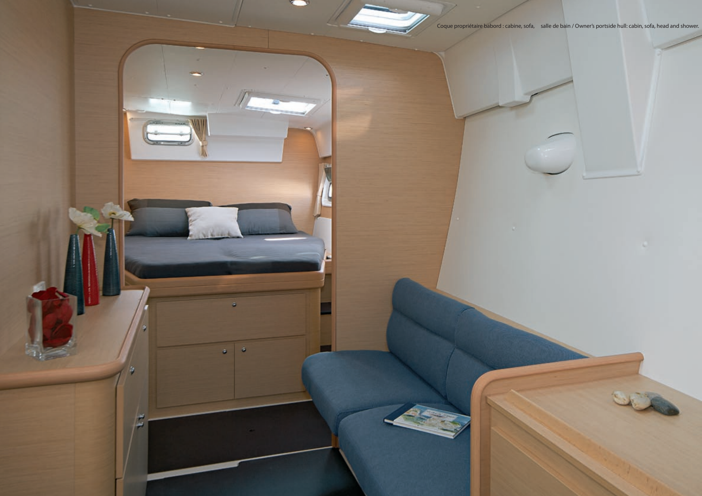
Coque propriétaire bâbord : cabine, sofa, salle de bain / Owner's portside hull: cabin, sofa, head and shower.