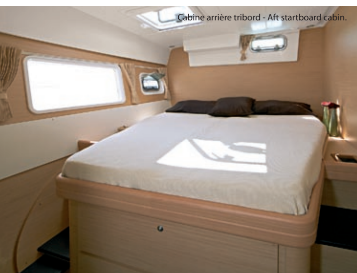
Cabine arrière tribord - Aft starboard cabin.

Trois ou quatre cabines doubles... Avec salle d'eau privée. Three or four double cabins... All with a private bathroom. Drei oder vier Kabinen... Mit eigenem Bad. Tres o cuatro camarotes... Con baño privado. Tre o quattro cabine... Con bagno indipendente.